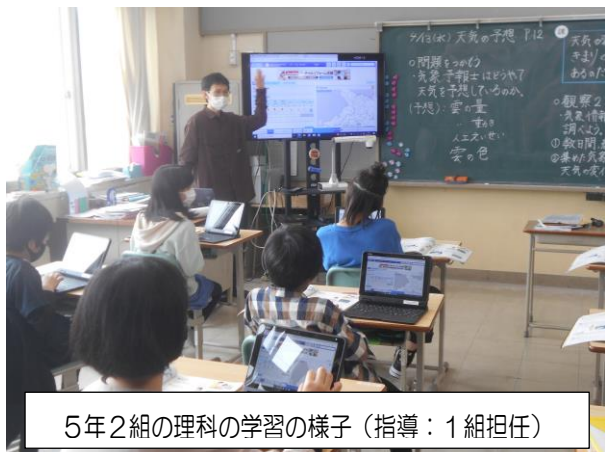
5年2組の理科の学習の様子(指導:1組担任)