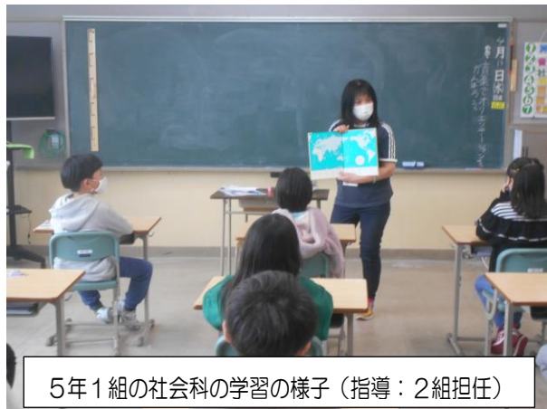
5年1組の社会科の学習の様子(指導:2組担任)